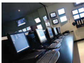
Centre de Télésurveillance