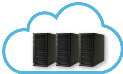
Serveur RISCO Cloud

Agility™3 avec VUPoint offre la vidéo en direct en réponse au déclenchement d'une alarme ou sur demande, assurant sécurité et contrôle inégalés.